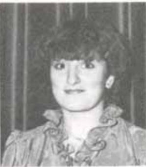
Antonietta Cassisi S. & G. Ceramic Tiles