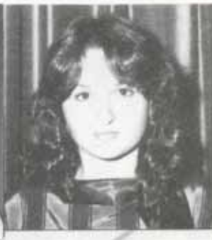
Pina Cantale Associazione Trinacria