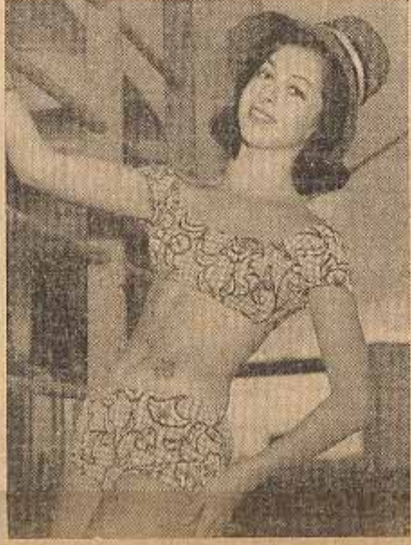
Particolarmente adatto per le "teenagers", questo elegante due pezzi ha già ottenuto i consensi delle ragazze australiane. Le maniche del corsetto conferiscono al modello battezzato "Dauphine", una nota caratteristica di eleganza.

tuarsi a vedere le cose con più modernità e, soprattutto, dobbiamo abituare le nostre figlie a saperci comportare con assoluta serietà morale anche fra l'allegria e la frequenza della compagnia profu-