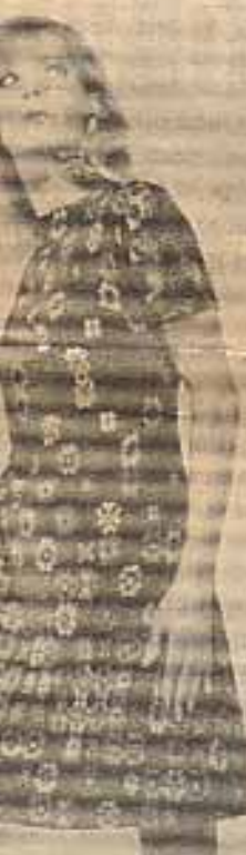
ey marrone stampato a nel toni del giallo, ma- a. Modello Valditivere

lavorata come in oro a 18 Kt. nel oratorio di