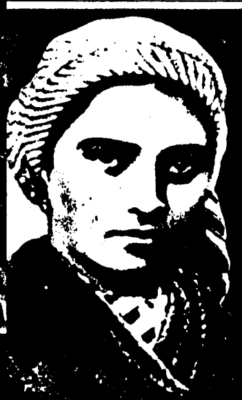
Body of St. Bernadette lies in a reliquary in the convent she entered at Nevers, France, 120 years ago. At left is a photograph of the young Bernadette as she appeared at about the time of the apparitions.