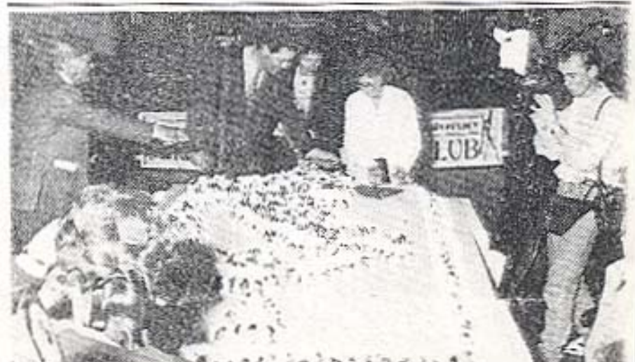
Il momento del tradizionale taglio della «monumentale» torta di buon compleanno