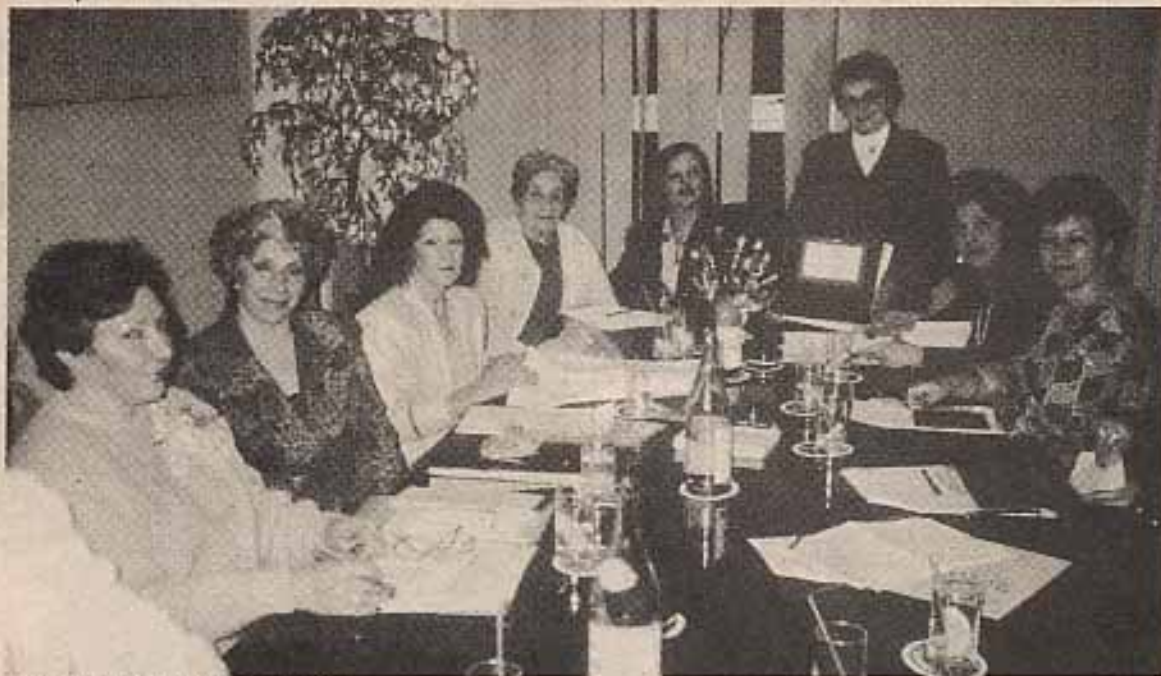
Il Comitato Femminile al lavoro.