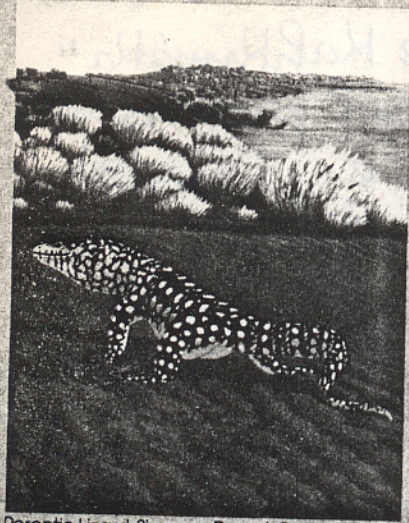
Perentie Lizard, Simpson Desert, Queensland.