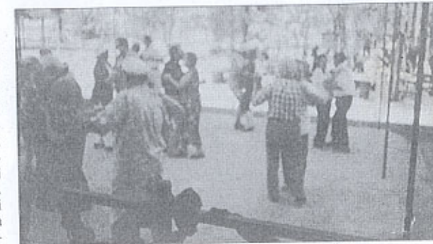
Le danze all'aria aperta.