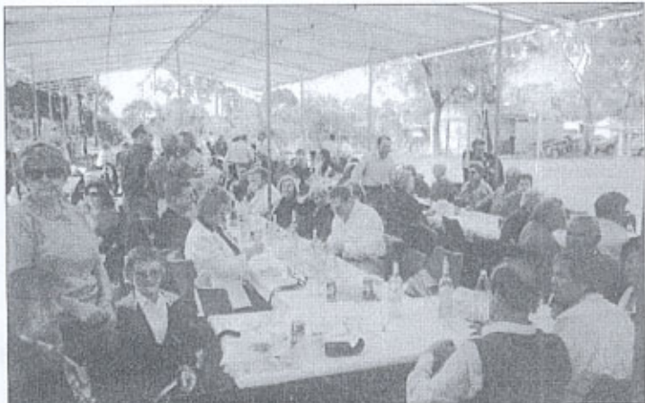
Partecipanti al Carnevale dei chersini.

Le maschere sono state rappresentate da alcuni bambini e tutti si sono divertiti danzando, giocando a carte o a bocce.