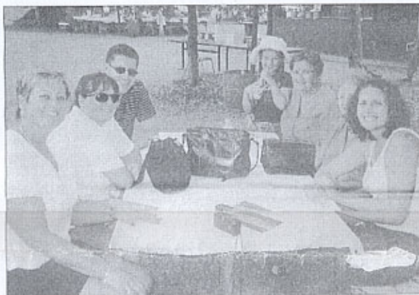
Una tavolata di giovani signore.

Insomma, una giornata allegra e divertente in ottima compagnia all'aria aperta.