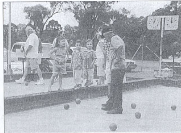
Le partite a bocce.