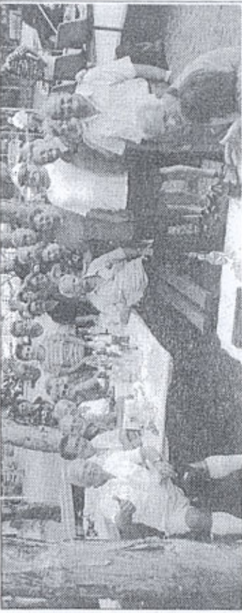
Un gruppo di partecipanti.