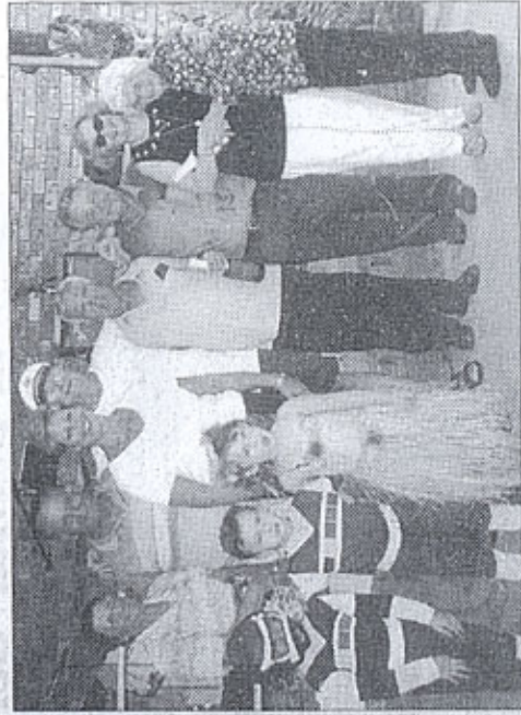
Il gruppo dei festeggiati.

SYDNEY - Domenica 25 febbraio, fra il verde dei boschi di Marsden Park dove si trova la sede del Club Smoc (Santa Maria di Cherso), si è svolto l'annunciato picnic per festeggiare il Carnevale 2001. Favorite da una bella giornata di sole sono accorse non meno di 300 persone, in maggior parte venete e giuliane, che in allegria hanno ricordato le loro terre lontane.