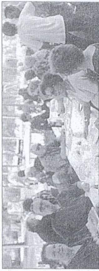
La tavola del gruppo dell'Associazione Giuliani.